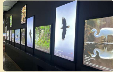
Mur de Suzanne Brûlotte

Une partie de l'équipe a participé à une formation sur le logiciel Skinsoft en janvier 2024. Cette formation avait pour but de voir les fonctions avancées du logiciel dédié à la gestion des collections.