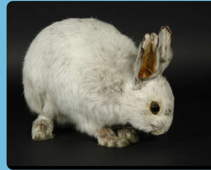
1995.1718.17 Lièvre d'Amérique prêté au Musée Léon-Provancher depuis 2019

Plusieurs dons sont venus enrichir les collections en 2023-2024. Le Musée a acquis 2 213 photos numériques de la faune, une tique, 10 instruments scientifiques, une peau de loup, 5 planches d'herbier ainsi que l'importante collection archéologique provenant des sites Kruger 1 - 2 - 3, gracieusement de Kruger inc.