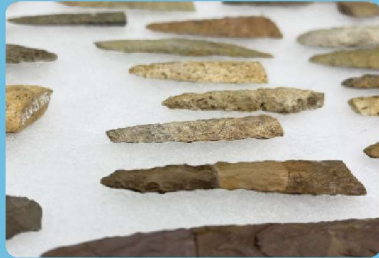
Quelques artefacts du site Kruger 3, don de la compagnie Kruger.