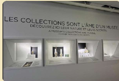
Mur de collections