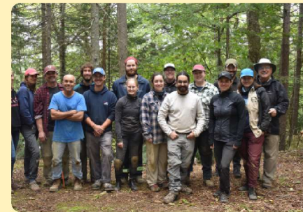
L'équipe de fouille archéologique, site Cliche-Rancourt, Mamsalhabika

L'équipe a consacré une grande partie de son temps à élaborer ou à mettre à jour une série de politiques et de documents exigés dans le cadre du renouvellement de l'agrément. La réponse du Ministère devrait nous être transmise à l'automne 2024.