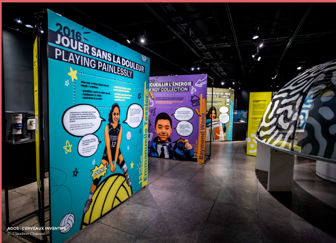
ADOS : CERVEAUX INVENTIFS © Claudine Chaussé