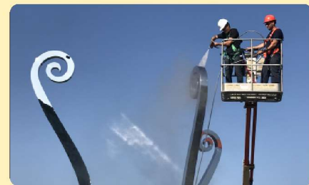
Art public; Les Sentinelles

Cette année, 10 096 diapositives ont été numérisées portant le total à 46 524 diapositives numérisées, identifiées, documentées, gravées, archivées et mises en réserve. Mme Brûlotte collabore toujours à la documentation des photos numérisées par le personnel de la conservation en nous transmettant diverses informations et anecdotes sur ses photos.