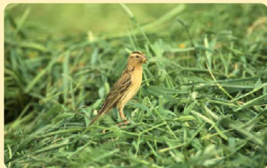
Femelle Goglu des prés cherchant son nid fauché