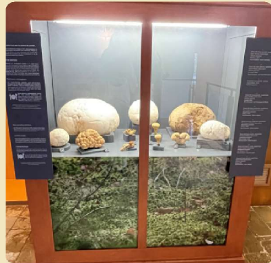
Vitrine hommage aux donateurs