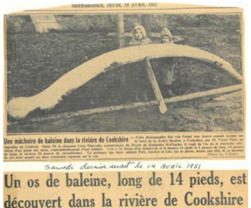
Journal La Tribune, 19 avril 1951