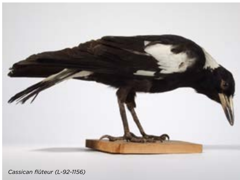
Cassican flûteur (L-92-1156)

En 1981, la collection s'enrichissait aussi en nombre et en diversité. En effet, les collections de l'Institut des Sourds-Muets, acquises par l'intermédiaire du ministère des Affaires Culturelles, s'étaient elles-mêmes diversifiées grâce aux voyages des religieux et des échanges entre institutions. À titre d'exemple, ce Cassican flûteur, gardé en captivité par le Jardin botanique de Sydney en Australie, a été enregistré puis naturalisé après sa mort au Musée de Sydney, le 4 septembre 1926. Il a parcouru un long chemin avant d'arriver en nos murs.