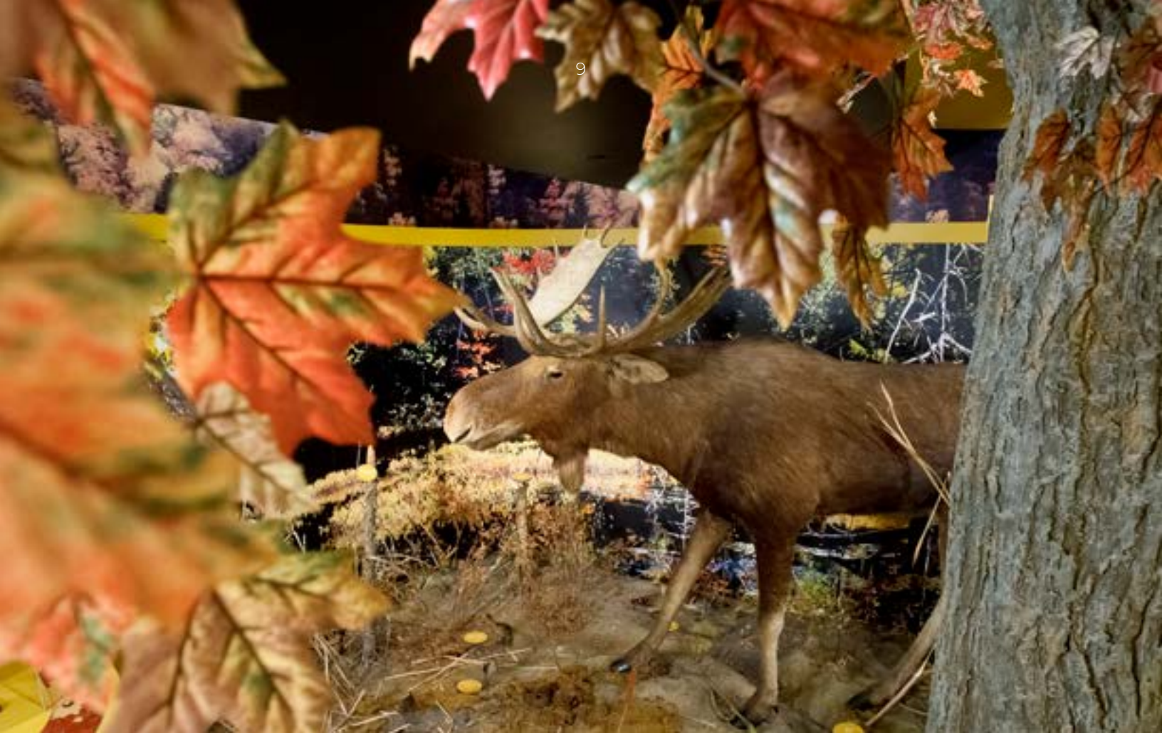
Exposition permanente « Au fil des saisons », Musée de la nature et des sciences, de 2002 à 2013

C'est aussi le cas de la mâchoire de baleine découverte dans la rivière Eaton à Cookshire et acquise au temps de Léon Marcotte en 1951. Dans les années 80, les analyses au carbone 14 indiquent qu'elle daterait de 370 \pm 50 AA 3 . Elle aurait été transportée à cet endroit par main d'homme.