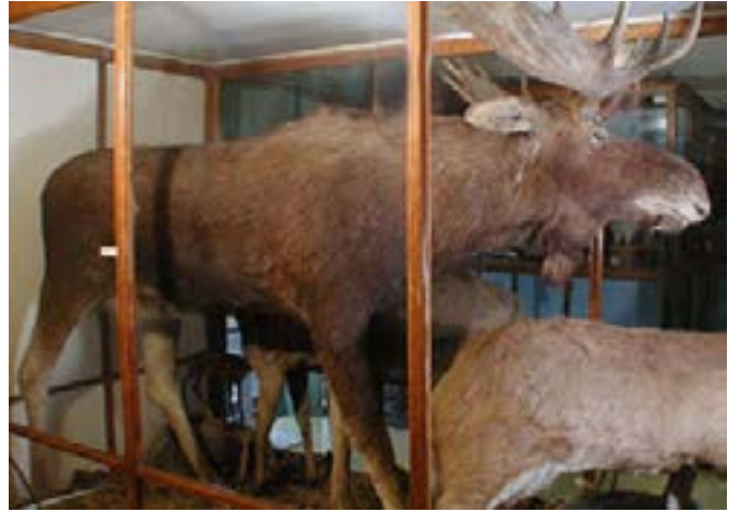
Au Musée du Séminaire de Sherbrooke jusqu'en 2002

Certains spécimens ont marqué l'imaginaire des visiteurs du Musée du Séminaire de Sherbrooke. C'est le cas de l'Original qui trône au Musée depuis 1925. Bien des générations auront profité du don des rhétoriciens de 1897-98, dont faisait partie Léon Marcotte, qui réunis en conventum en 1925, ont donné la somme de 100,00 $ affectée au montage de cet Original.