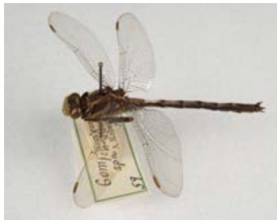
Gomphus spicatus d'Adrien Robert