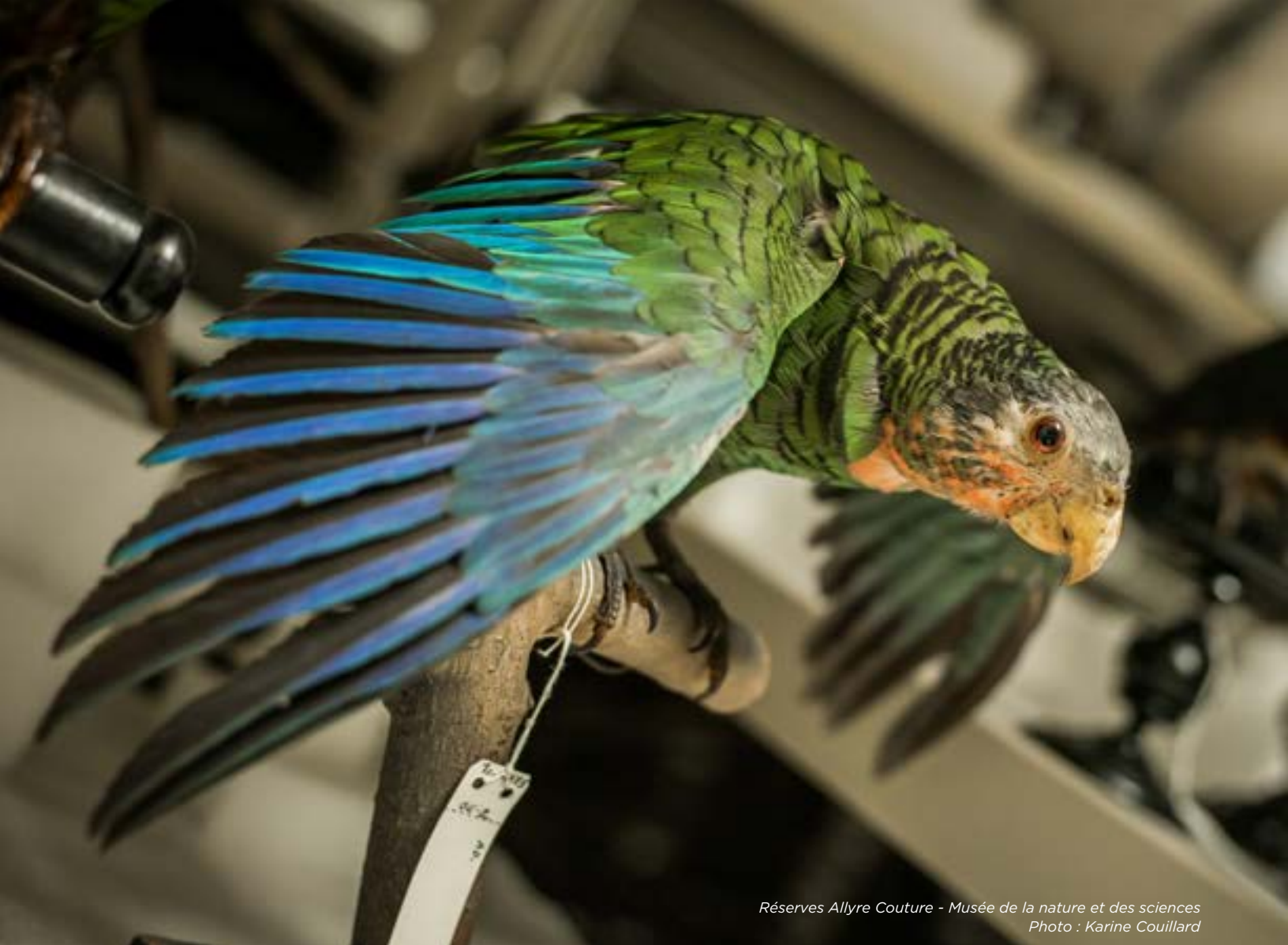
Réserves Allyre Couture - Musée de la nature et des sciences

Ce bulletin se veut un éloge aux membres du clergé qui ont permis au Musée d'être ce qu'il est aujourd'hui et une rétrospective des moments les plus marquants de l'apport des communautés religieuses dans le développement des collections. Bien que la majorité de ces gens soient aujourd'hui décédés, leur travail continue de profiter aux nouvelles générations. Les collections du Musée totalisent en 2019 environ 65 000 objets dont 29 300 ont été enregistrés. Il reste un travail colossal d'inventaire et de documentation pour sortir de l'ombre d'autres acteurs. C'est toujours un moment important pour les employés du secteur de la conservation de révéler de nouvelles histoires et ainsi assurer la transmission de connaissance.