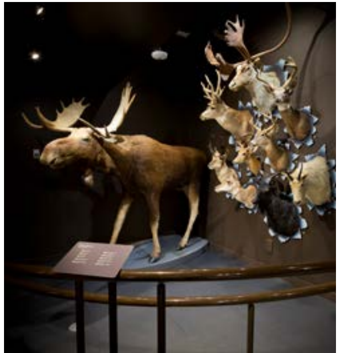
Exposition permanente « Alteranima », Musée de la nature et des sciences, depuis 2013 - photo : Jocelyn Riendeau